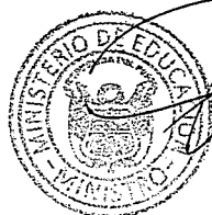
JAIME SAAVEDRA CHANDUVÍ Ministro de Educación